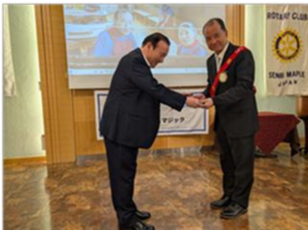
高尾会長から水本会長エレクトへ引継ぎ