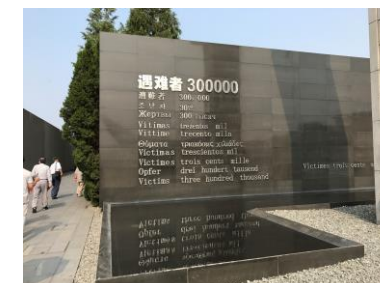
南京大虐殺記念館