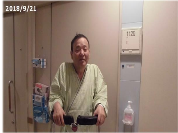
病院食で少し やつれています

2018年9月21日 手術3日目 (1) 朝から右膝の痛みゼロ。右足が赤い。(写真) (2) 右足を地面に着けても痛み無し。 (3) 朝10時~11時に機械での屈伸運動開始。80度から。痛い。 (4) 11:05~11:35医師による、各種曲げ伸ばし運動。 (5) 1階廊下での歩行器歩行開始。痛くて、痛くて。 (6) 看護師にボルタレンを頼むが、トラムセットを服用された。効きが悪い。 (7) 歩けるのか心配になる。 (8) 痛み止めに看護師に懇願する日であった。 (9) 妻が朝早くから見舞いに。長男夕方、見舞いに。 二人で焼肉を。翌日聞くと妻は、生ビール2杯にカクテル3杯。 長男と二人きりは、初めてみたいで嬉しそう。 可愛い妻です。 (10) 私は痛みと格闘中。