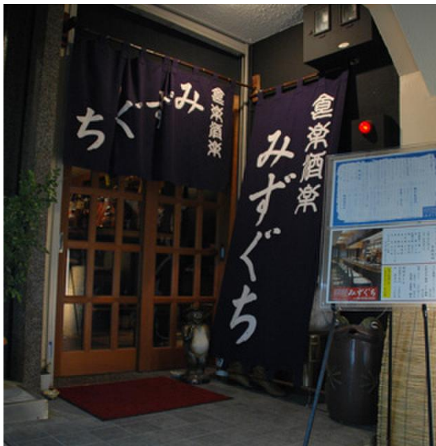
割烹 居酒屋 みずぐち 17時30分 開宴