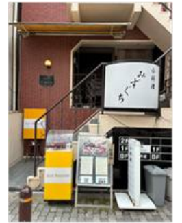
大阪天満宮前 割烹 居酒屋 みずぐち